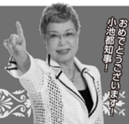
おめでとう! 初の女性都知事誕生! 小池都知事

頑張れ、小池都知事。都民よる都民た めの都政の実現を。 組織票もなく、290万人以上の票を得 た。その間、貶めるような数々の批判も 受けながら良く戦われた。 柏原市において「市民による市民のた めの市政」を目指したが実現できずに?